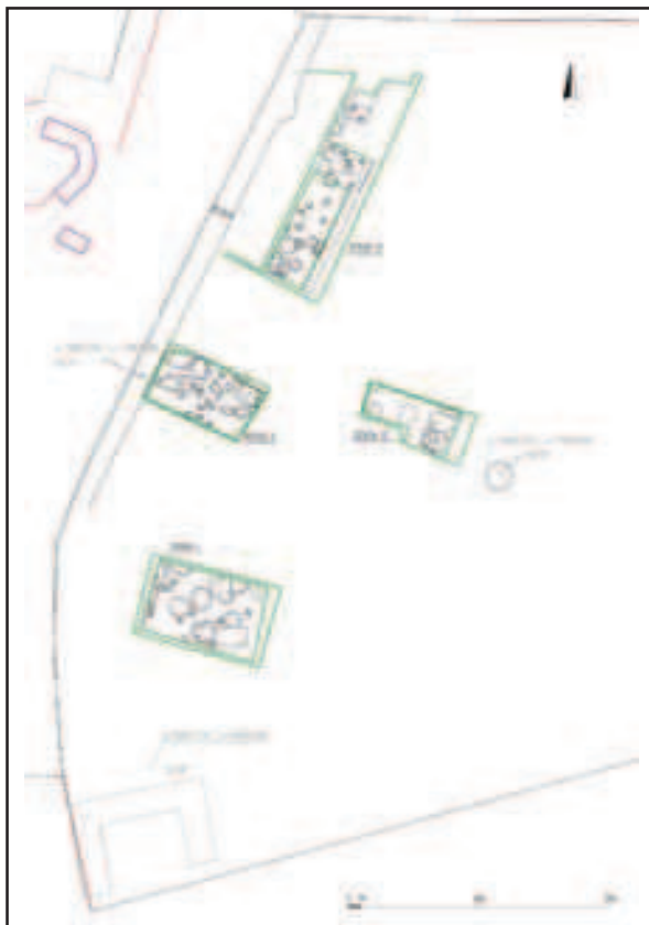
Park Grič, kompozitni tlocrt (izradili: A. Bugar, J. Burmaz)