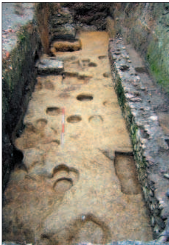
Park Grič, sonda 3

potvrditi samo daljnjim istraživanjima. Valja istaknuti i nalaze dvaju stariježeljeznodobnih naseobinskih objekata, od kojih je jedan mogao biti dio radioničkog kompleksa (objekt IV) dok je u drugom (objekt VI) pronađeno vatrište unutar kojeg su ostali sačuvani brojni ulomci keramike i kućnoga lijepa. Tom horizontu treba pripisati i nalaz ostataka prijenosnog ognjišta pronađenog u jami 70. Jedan od najvažnijih nalaza ove kampanje jest nalaz istrošenoga brončanog novca koji je probušen, a kroz rupicu je bila provučena željezna žica u funkciji karičice. Novac nije pronađen u zatvorenoj nalaznoj cjelini, već na